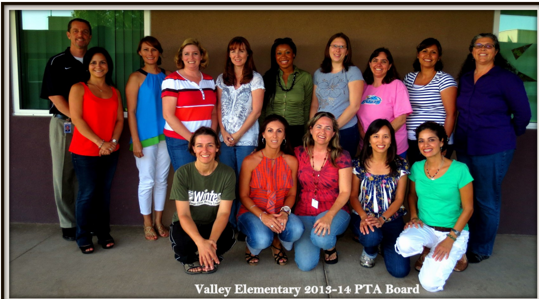
Valley Elementary 2013-14 PTA Board